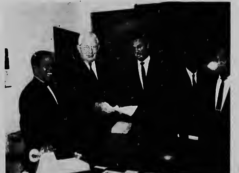
Antayera e movimiento sindicalista asina hoben na Bonaire, a firma e promer contrato colectivo di trabao. E contrato tabata entre Algemeene Federatie van Bonairiaanse Werknemers y directiva di Handelsmaatschappij Bonaire N.V., Handelsmaatschappij Kralendijk y Technische Handelsmij, Bontech. E promer contrato colectivo aki ta nifica un mehoramiento importante den e condicionnan di trabao pa e trahadornan miembro di e bond, especialmente despues di e periodo di intranquilidad cu tabata reina anja pasa na Bonaire den e sector obreril. Nos ta spera cu e relacionnan entre donjo di trabao y trahadornan lo keda mes cordial cu nan tabata na momento di firmamentu di e contrato aki.